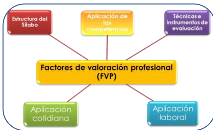
Figura 5. Categoría 3