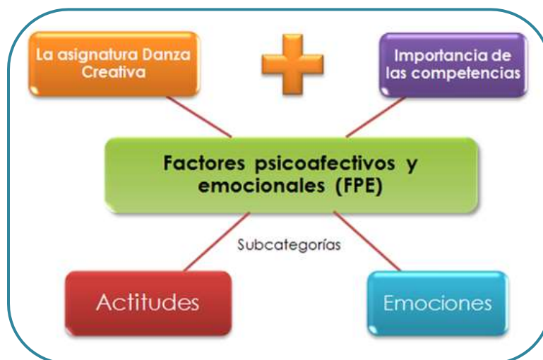
Figura 4. Categoría 2