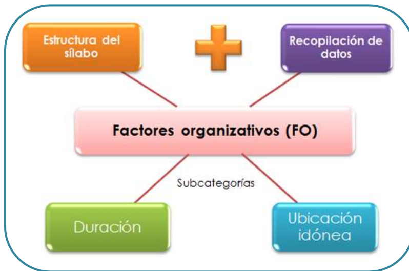
Figura 6. Categoría 4