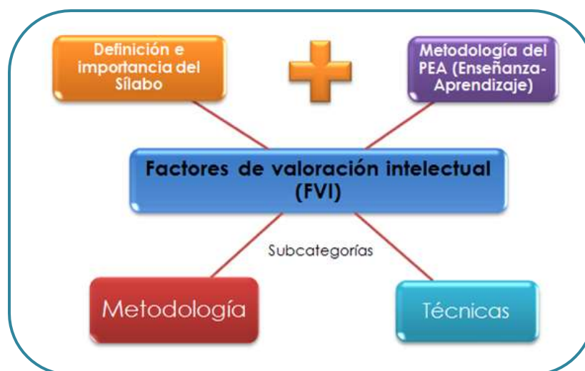
Figura 3. Categoría 1