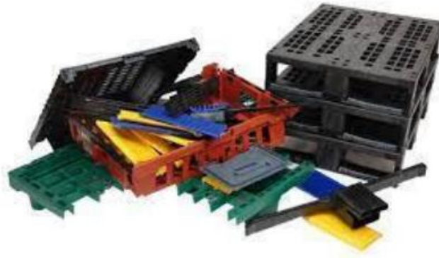
Imagen 2: Pallets de plástico usados que van a ser de utilidad en la creación de nuevos pallets (go plastic pallet, 2024).

Este ahorro en el costo de materia prima reciclada será trasladado al cliente ofreciendo un 10% de descuento en sus nuevos pallets según los kilos recolectados contra los kilos que representa una unidad de pallet plásticos reciclados. Este desperdicio / materia prima podremos usarla entre un 30-40% (según su nivel de degradación) en la fabricación de un nuevo pallet de plástico reciclado RENOVA PALLETS reduciendo su costo y volviendo el modelo de negocios más rentable y atractivo.