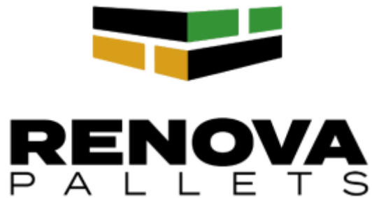
Imagen 4: Logotipo “RENOVA Pallets”

El logotipo de Renova Pallets complementa nuestra identidad visual. El logotipo presenta un diseño moderno y fresco, que representa el ciclo de transformación y renacimiento del plástico reciclado. El uso de colores verdes y mostaza transmite nuestro compromiso con la sostenibilidad y el medio ambiente. También hemos incorporado elementos que simbolizan la resistencia y la durabilidad de nuestros pallets, lo que refuerza la confianza de nuestros clientes en nuestros productos.