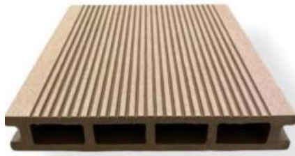
Imagen 3: Diseño del pallet con estructura de mayor resistencia y menor peso

Otro punto importante es el diseño del pallet, usualmente en la fabricación de tabloncillos plástico estos son macizos con un cuerpo robusto por que la materia prima es de muy mala calidad. Nosotros propondremos una estructura con mayor resistencia y menor peso gracias a la calidad estandarizada y homogénea de residuos plásticos industriales o post consumo que hay disponibles junto a nuestro aliado estratégico RECYCLE by NUTEC.