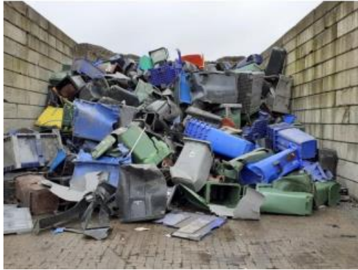
Imagen 1: Residuos de plástico que cumplieron su vida útil (Plastic Portal, s.f.)

B. Recolección de scrap plástico post consumo , de industrias o centro de acopio donde seleccionaremos y clasificaremos a los proveedores para tener la materia prima de mejor calidad para la fabricación de nuestros pallets plásticos reciclados.