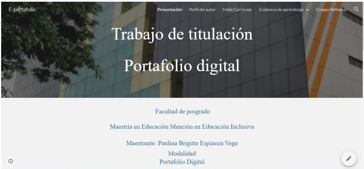
Captura de pantalla de página de inicio del portafolio digital