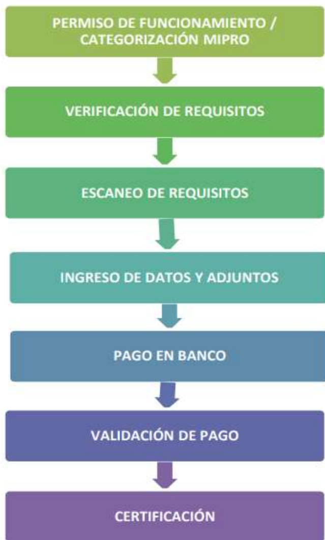
Ilustración 1. Flujo de obtención de notificación sanitaria por proceso simplificado