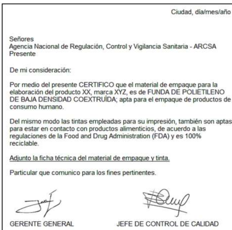
Ilustración 2. Ejemplo de certificado de material de envase

NOTA3: En caso de adquirir el envase en una distribuidora el certificado del material del envase puede otorgarlo la misma distribuidora, adjuntando las fichas técnicas del material de envase que provee el fabricante.