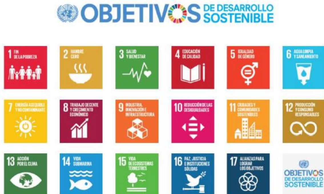
Figura 2 Objetivos de Desarrollo Sostenible (ODS)

Dentro del análisis de responsabilidad social corporativa con respecto a Sacha Bag se toman en consideración los Objetivos de Desarrollo Sostenible (ODS), tomados y adoptados por la Organización de Naciones Unidas (ONU).