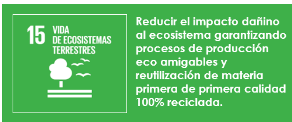
Figura 5 Estrategia 3 en vida de ecosistemas terrestres.

Nota: Delimitación de la estrategia con responsabilidad social y empresarial de Sacha Bag con referencia al Objetivo 15 de los ODS, elaborado por los autores (2022).