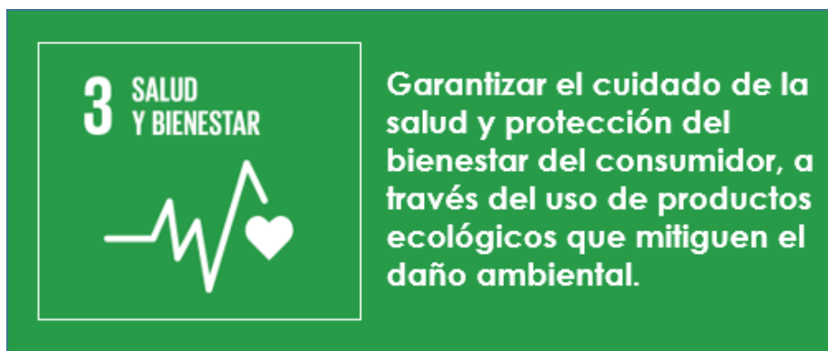
Figura 3 Estrategia 1 en salud y Bienestar

Nota: Delimitación de la estrategia con responsabilidad social y empresarial de Sacha Bag con referencia al Objetivo 3 de los ODS, elaborado por los autores (2022).