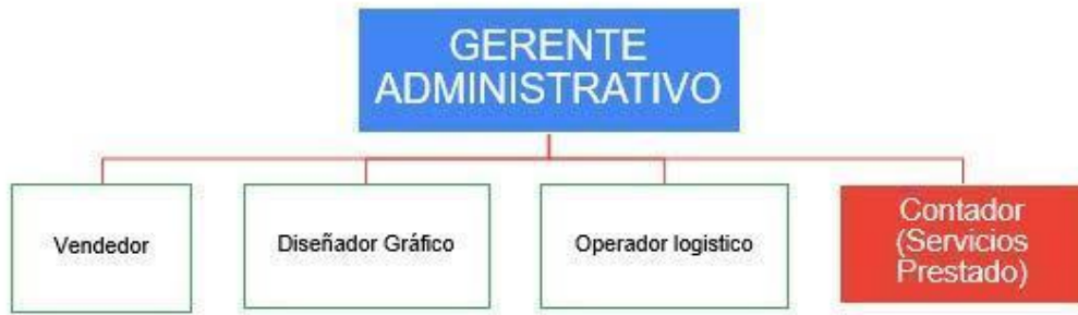
Figura 1 Organigrama - Sacha Bag

cargo de los accionistas, donde recae la responsabilidad, el funcionamiento y la ejecución de los proyectos empresariales.