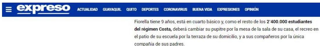
Figura 3. Primer párrafo de la nota #4

La observación más importante de esta subcategoría es la falta de las fuentes infantiles y adolescentes, y a su vez, el uso de fuentes adultas como portavoces de los NNA. La mitad de la muestra sólo incluyó a las voces adultas, entre autoridades gubernamentales, padres de familia, docentes, administrativos, gremios, y expertos. De las 5 restantes, sólo una (nota #3) incorporó citas textuales de los NNA consultados; las otras cuatro (notas #4, #8, #9 y #10) se limitaron a breves descripciones demográficas (nombre, edad, año escolar). Por ende, se concluye que existe un desarrollo de argumentos primariamente desde la perspectiva adulta.