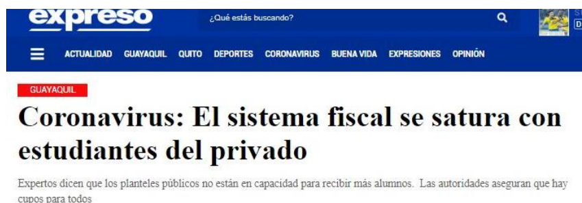
Figura 1. Titular y sumilla de la nota #5

Se identificó que en 8 de las 10 piezas, los titulares se mantienen a lo largo del desarrollo (las excepciones son las notas #1 y #4). En cuanto a las estrategias para formular los titulares, se observó 3. La primera es el uso de datos que destacan el enfoque y la información recopilada, la cual se aplica en la nota #1 y #7. La segunda se enfoca en incorporar una cita textual de una de las fuentes citadas, como en la nota #6, lo cual genera impacto desde las propias palabras de los involucrados. La tercera se basa en plantear una afirmación que englobe el enfoque de la noticia. Dicha oración puede estar basada en conclusiones a las que llegó la periodista tomando en cuenta las declaraciones que le proporcionaron las fuentes. Esta es la más usada: 7 de las 10 notas implementaron este mecanismo.