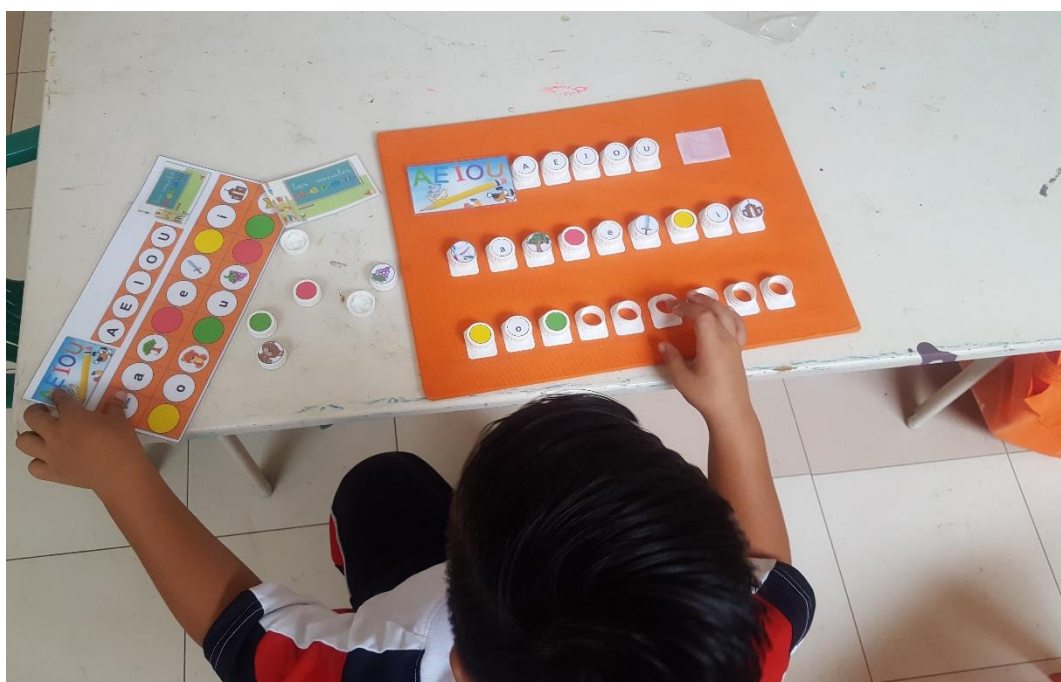
Estudiante aplicando los conocimientos adquiridos en la innovación