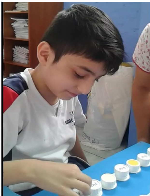
Estudiante enroscando tapillas