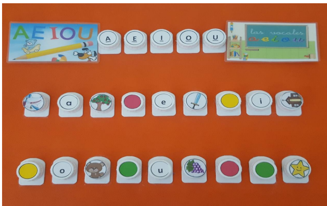
Tablero de vocales e imágenes