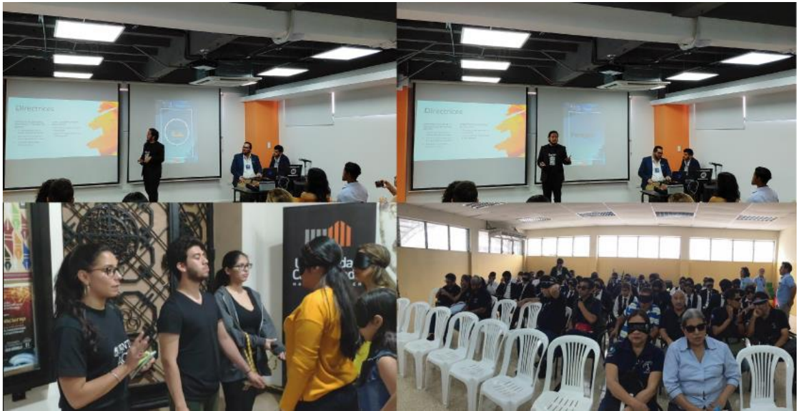
Figura 4. Agradecimientos y promoción de marca en las actividades del proyecto.

A continuación se puede evidenciar el cumplimiento acorde al paquete de auspicios seleccionado por parte de D&G Barcazas y Fundación Paragon Galápagos, el cual fue el paquete “Teatro a ciegas”.