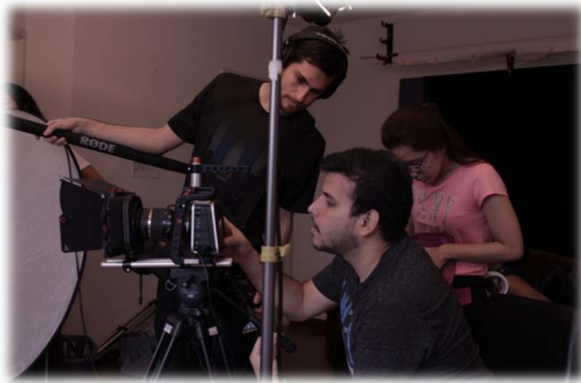
Foto del trabajo colaborativo del director de fotografía, directora de arte, director de sonido y asistente.