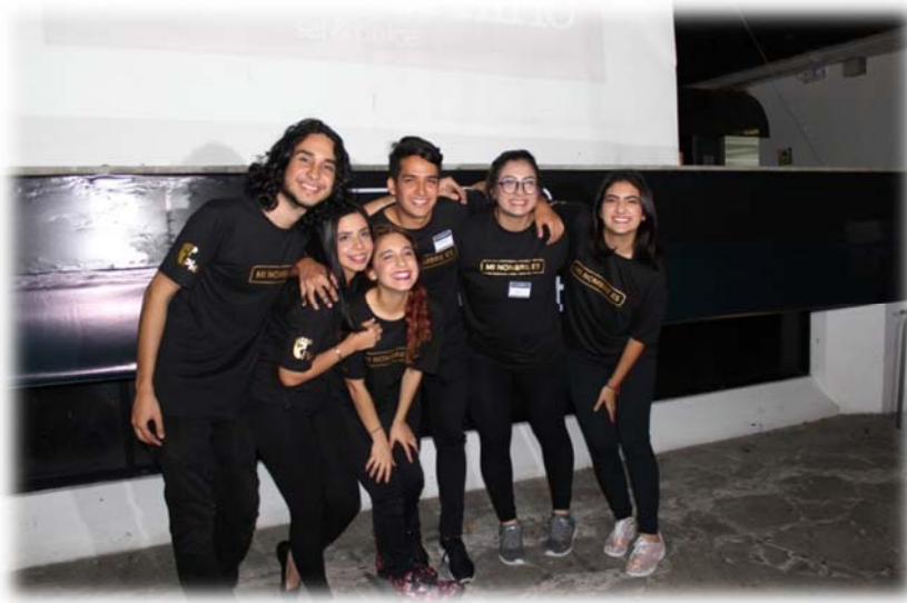
Foto del director de fotografía y sonido

Foto del equipo de trabajo “Mi Nombre Es”