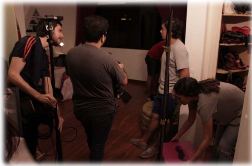
Foto del Equipo actoral